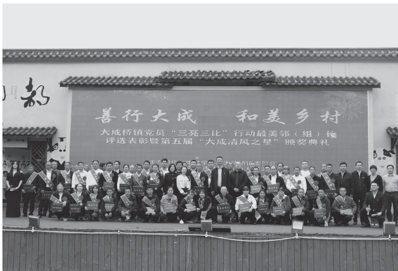
▲ “大成清风之星”颁奖典礼