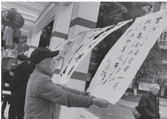
▲ “院子里”邻家书画展