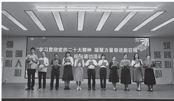
▲成安县组织基层宣讲员开展党的二十大精神集体诵读