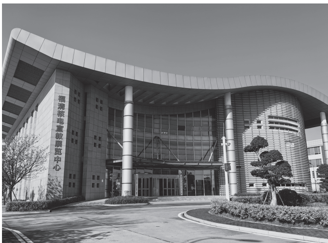
▲中核集团中国核工业科技馆（福清）